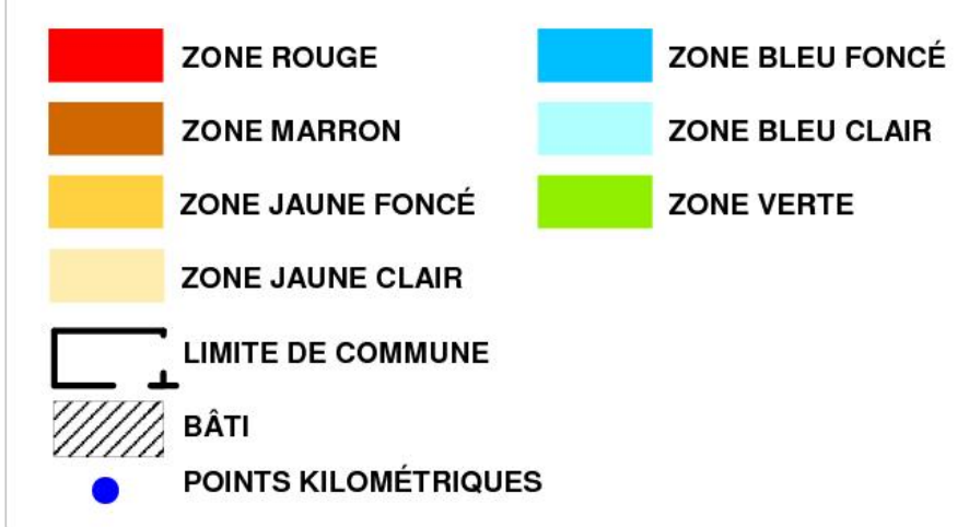
PLANCHE 2/6 - Echelle : 1/5000 ème

Approuvé par l'arrêté préfectoral 2009/0824/DRP n° 095 en date du: 27 NOV. 2009