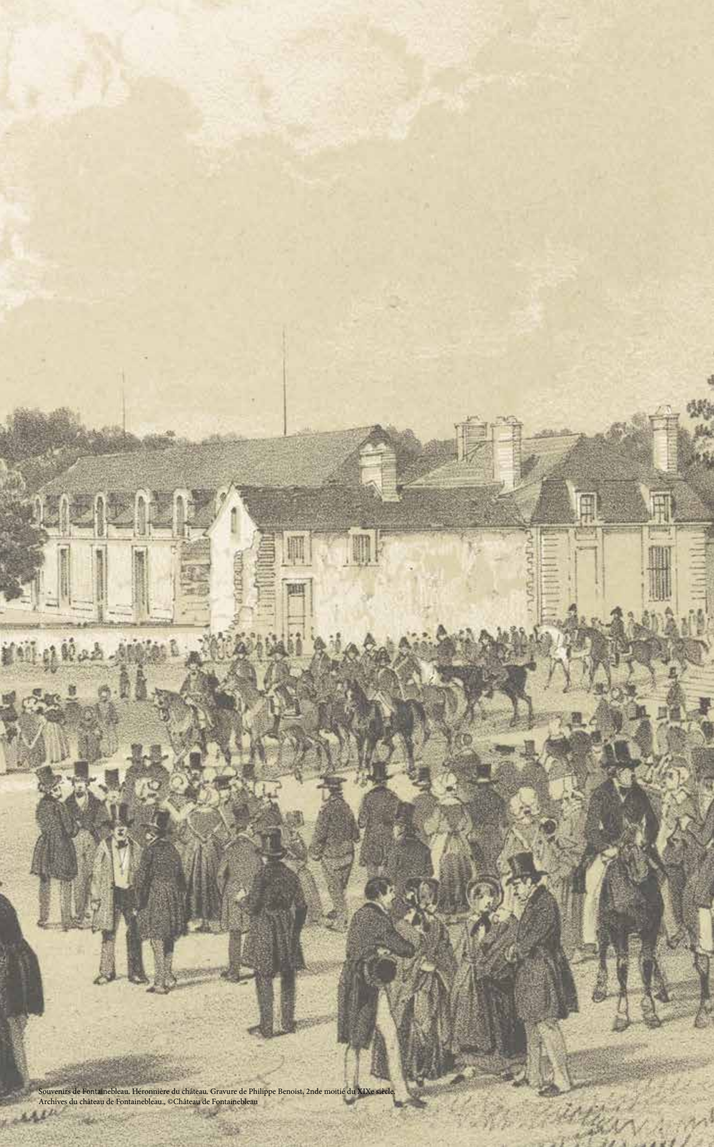
Souvenirs de Fontainebleau. Héronnière du château. Gravure de Philippe Benoist, 2nde moitié du XIXe siècle.