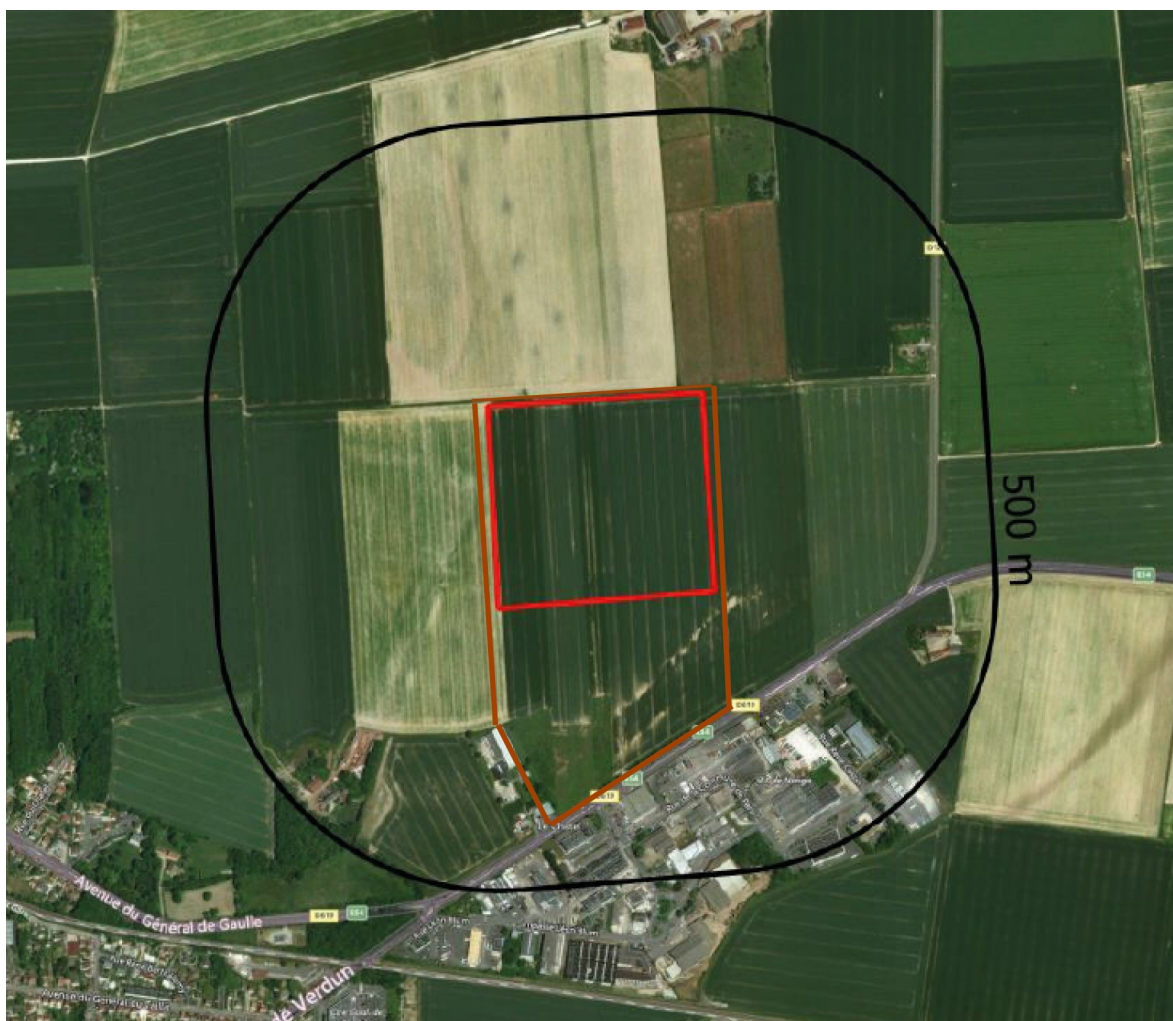
Figure 1: plan de situation

Cette opération d'aménagement prévoit d'accueillir des activités économiques après viabilisation de 25 ha de terres agricoles. Elle a fait l'objet d'une étude d'impact et d'un avis de l'autorité environnementale émis le 18 mars 2011, dans le cadre de la procédure de création de la ZAC. Cette étude d'impact a été actualisée en 2013 dans le cadre de la procédure d'enquête préalable à la déclaration d'utilité publique aux fins d'acquisitions foncières. Un nouvel avis de l'autorité environnementale, portant sur l'étude d'impact actualisée de la ZAC « Nangis Actipôle », a été émis le 20 octobre 2013 4 .