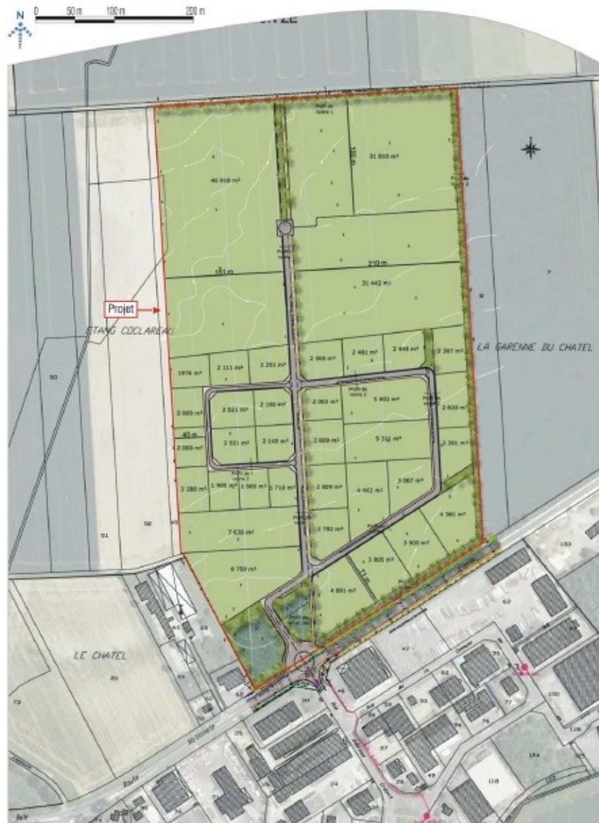
Figure 2: Plan masse de la ZAC "Nangis Actipôle"

D'après l'étude d'impact du présent projet de plateforme logistique (pages 14-15), le projet est réalisé sur les trois parcelles de trois à cinq hectares initialement envisagées au nord de la ZAC. Celle-ci ne prévoit en effet pas de lots d'une superficie supérieure à 5 ha. Il est également précisé que le projet de plateforme serait la première entreprise à s'implanter au sein de la ZAC et que la destination finale des lots situé au sud n'est actuellement pas connue. Or, le phasage prévu pour la ZAC (telle que soumise à évaluation environnementale en 2013) consiste à urbaniser en priorité la partie sud de la ZAC.