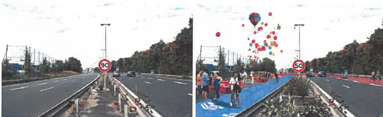
RD 199 actuelle

La requalification de la RD199 permettra de créer de nouveaux liens urbains et paysagers et d'assurer la transition urbaine et le recollement entre la ville économique, le cœur de cluster, et la ville nature. Sa mutation en boulevard urbain à circulation apaisées, permettra également de recréer des liens entre les quartiers existants.