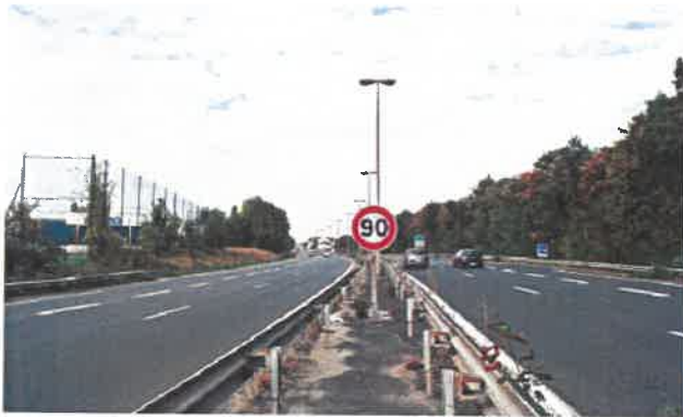
RD 199 actuelle