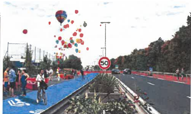
RD 199 requalifiée