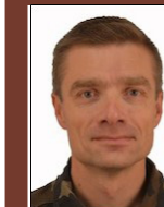
Délégation militaire départementale Général de Brigade Paul SANZEY