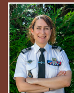
Groupement de Gendarmerie départementale Colonel Mélanie DURIER