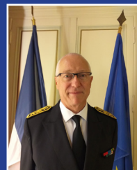
Préfet Pierre ORY