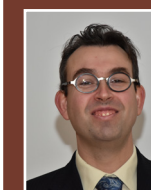
Direction des archives départementales Joseph SCHMAUCH