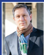
Préfet délégué à l'égalité des chances Benoît KAPLAN