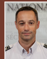
Direction départementale de la sécurité publique Contrôleur général Antoine SALMON