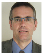
Sous-préfet de Meaux Nicolas HONORÉ