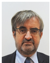
Sous-préfet de Torcy François-Claude PLAISANT