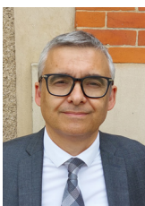
Sous-préfet de Provins Jean-Bernard ICHÉ