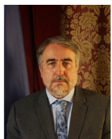
Sous-préfet de Fontainebleau Thierry MAILLES