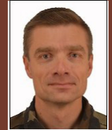
Délégation militaire départementale Général de Brigade Paul SANZEY