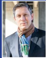
Préfet délégué à l'égalité des chances Benoît KAPLAN