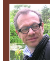
Unité départementale de l'architecture et du patrimoine Jean-Louis AUGER