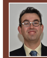
Direction des archives départementales Joseph SCHMAUCH