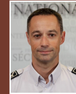
Direction départementale de la sécurité publique Contrôleur général Antoine SALMON