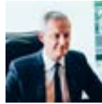
Bruno Le Maire

Ministre de l'Économie et des Finances @BrunoLeMaire