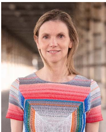
Agnès Pannier-Runacher, secrétaire d'État auprès du ministre de l'Économie et des Finances

SignalConso est un dispositif d'alerte de la Direction générale de la concurrence, de la consommation et de la répression des fraudes (DGCCRF) qui permet de signaler en quelques clics des difficultés dans le domaine de la consommation et d'obtenir des conseils pour agir.