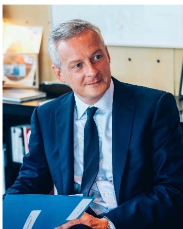
Bruno Le Maire, ministre de l'Économie et des Finances

La consommation est un acte du quotidien pour les Français. Les erreurs, les fraudes, les arnaques, les manquements aux règles de sécurité sont autant de situations qui peuvent avoir des conséquences lourdes sur le pouvoir d'achat ou la santé des consommateurs. Même mineures, les infractions à la réglementation sont toujours vécues comme irritantes.